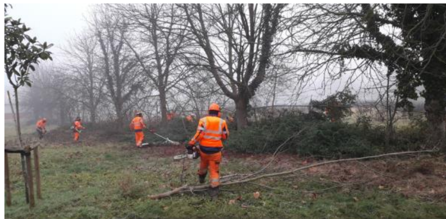
Beheer van de kastanjes op de Verversgracht