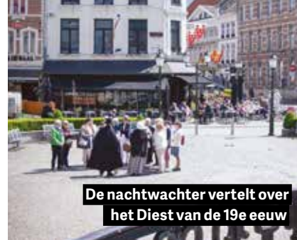
De nachtwachter vertelt over het Diest van de 19e eeuw