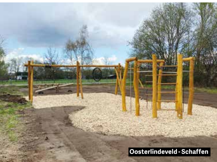
Oosterlindeveld - Schaffen

Speelplezier verzekerd, ook in de toekomst! De jeugddienst werkt immers aan een studie rond het speelruimtebeleid in onze stad. Ze laat zich daarin ondersteunen door kennis- en expertisecel Kind & Samenleving. Zo wil ze de speelruimte in Diest op een slimme en doordachte manier vormgeven.