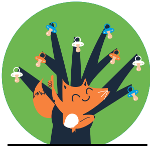
Vosje Vivi en de tutjesboom