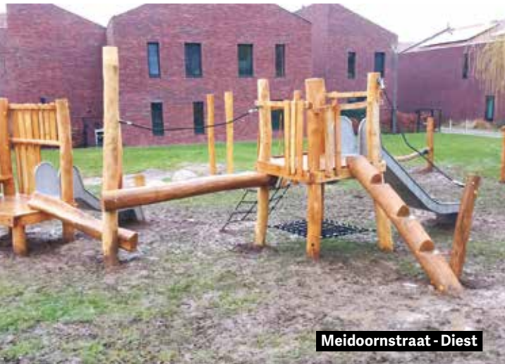
Meidoornstraat - Diest

Heb je de nieuwe speeltuinen in de Meidoornstraat in Diest en in de Kalverbergstraat in Schaffen al ontdekt? Ook op het Oosterlindeveld in Schaffen is een nieuwe speeltuin binnenkort klaar voor gebruik.