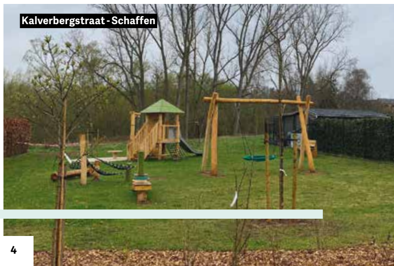
Kalverbergstraat - Schaffen

Je leest het al: een kwalitatief speelruimtebeleid vertrekt vanuit een totaalaanpak en houdt rekening met andere bestaande beleidsplannen. Het startschot is inmiddels gegeven. Het volledige beleidsplan zou begin volgend jaar op tafel moeten liggen.