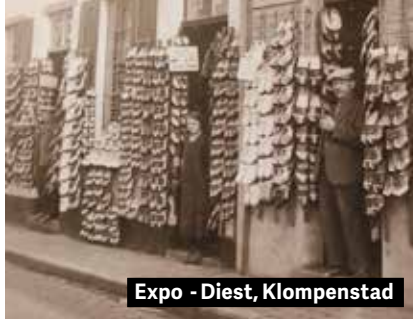
Expo - Diest, Klompestad